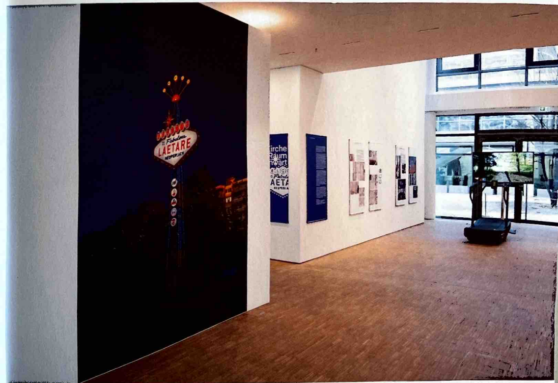
Ausstellungsansicht Kirche Raum Gegenwart , DG Kunstraum Diskurs Gegenwart, 2023.